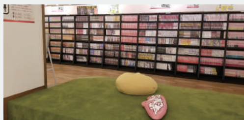
館内は広々としたスペースで、マンガも多数用意されています。