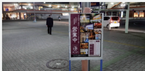
駅からは案内の看板が用意してあるので迷わずに辿り着くことができます。